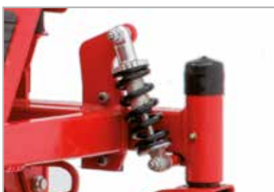
Amortiguación delantera independiente

Resistente motor Commercial Turf™ 8270 V-Twin de Briggs & Stratton cuenta con filtro de aire ciclónico, filtro de aceite y lubricación a presión.