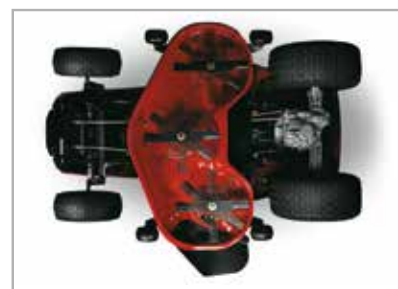
Plataforma de corte con tres cuchillas