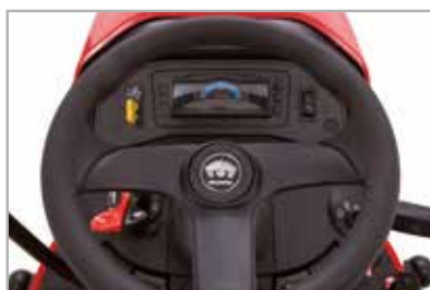
Cuadro de instrumentación superior