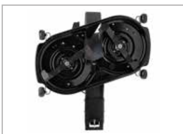
Plataforma de corte asimétrica de 107 cm con cuchillas rediseñadas