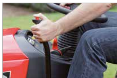
Palanca de acople de la plataforma