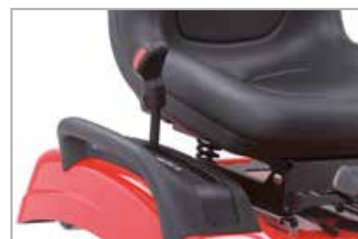
Control de crucero