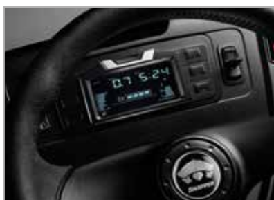
Cuadro de mandos digital

ELECTRONIC FUEL MANAGEMENT STARTING MADE SIMPLE.