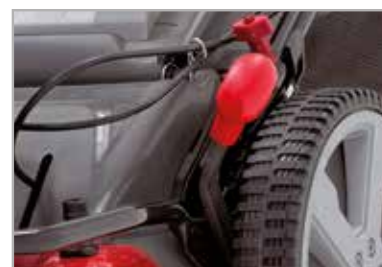
Mando centralizado para 6 alturas de corte