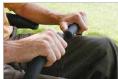
Controles suaves y acolchados