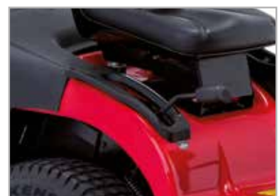
Altura de corte de 7 posiciones de entre 3,8 y 8,9 cm