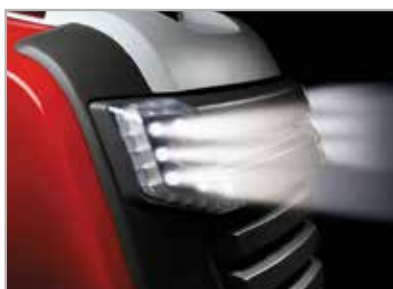
Luz frontal con LED