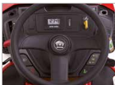
Cuadro de conducción con cuenta-horas, indicador de voltaje de batería y recordatorio de mantenimiento