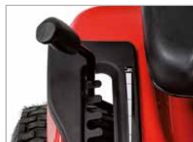
7 posiciones de altura de corte