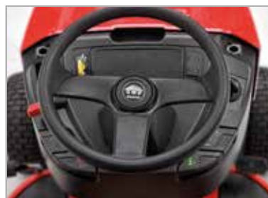
Handig op het dashboard geplaatste bedieningselementen