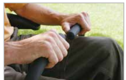
Zachte dubbele stuurhendels