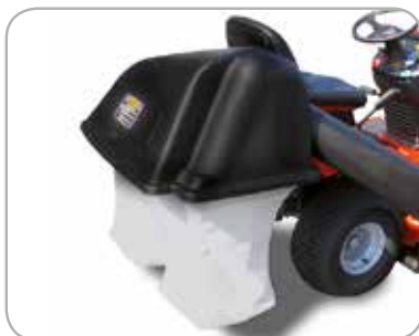
Opvangbak met twee zakken Opvangen met een zitmaaier met zijuitworp.