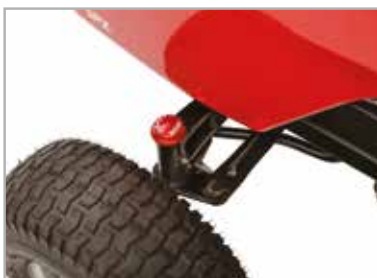
Duurzame draaibare gietijzeren vooras