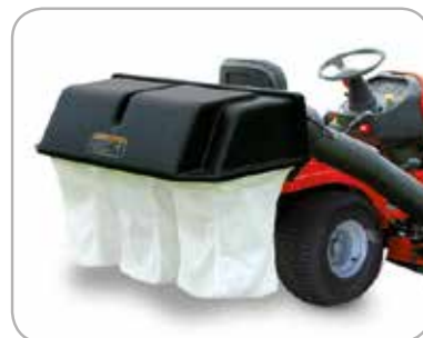
Opvangbak met drie zakken Opvangen met een zitmaaier met zijuitworp.