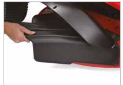
Zonder gereedschap ombouwen van mulching naar zijlossing