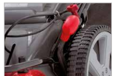
Gecentraliseerde in 6 maaihogtes verstelbare hendel