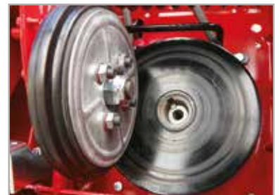
Schijftransmissie met variabele snelheid