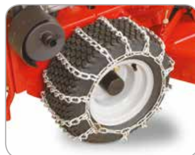
Sneeuwkettingen Voor gebruik op gladde ondergronden zoals ijs en sneeuw.