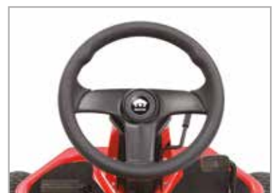
Stuur met zachte grip