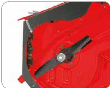
Mulching Kit Voor een gemakkelijke ombouw naar een mulchdek.