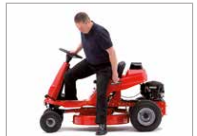
Vlot opstapbaar platform design