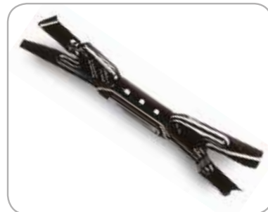
Ninja® Mulching Mes Voor een gemakkelijke ombouw van een maaier met zij- uitworp of met grasopvang naar een mulchmaaiër.