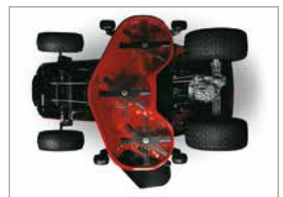
Stalen maaidek met drie messen