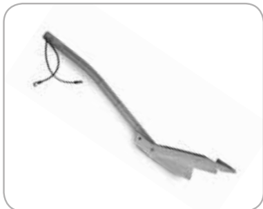
Mulching plug Converteer uw achteruitworp in een mulchingmaaiër.