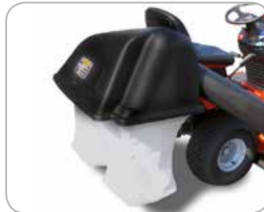
Oppsamler med to poser Oppsamler som fungerer godt for en gressklipper med sideutkast.