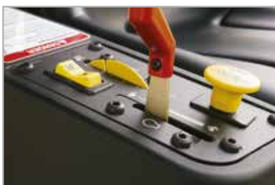
Lett å bruke kontrollspaker