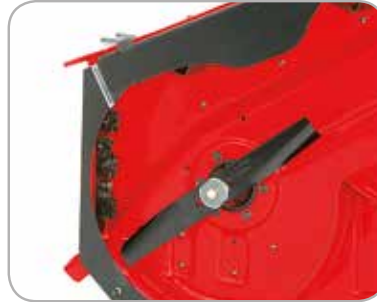
Bioklipp kit Muligheten til å lett skifte til bioklipp.