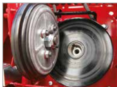
Variabel friksjons disk drivsystem