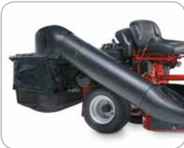
Oppsamling i en pose Lett tilgjengelig oppsamler med en kapasitet på 175 liter.