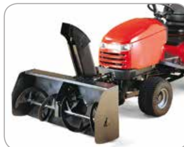
Snofreser Perfekt når du trenger å fjerne snø fra veien.