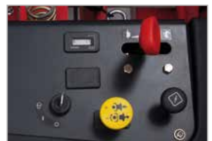
Styrespaker som er "enkle i bruk"