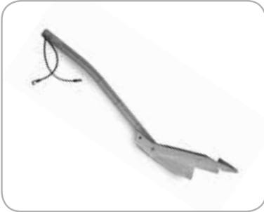
Bioklipp plugg Forvandle din traktor med utkast til en biogressklipper.