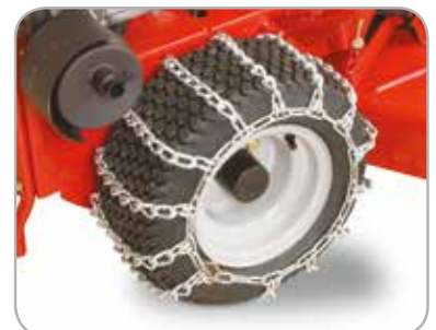
Kjettinger til dekk Når du må kjøre på glatte overflater som snø og is.