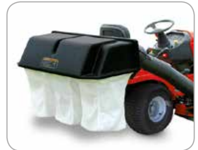
Oppsamler med tre poser Oppsamler som fungerer godt for en gressklipper med sideutkast.