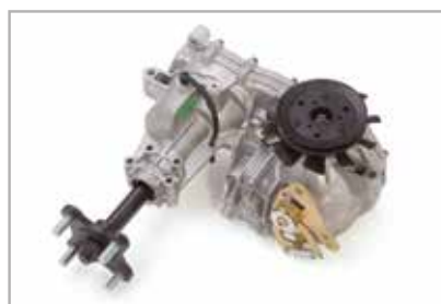
Hydro-Gear® hydrostatic girkasse