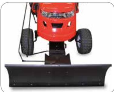
Snoplog Perfekt når du trenger å fjerne snø fra veien.