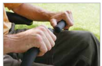
Mykt grep på kontrollspakene