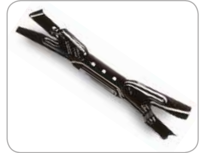
Ninja® Bioklippkniv Forbedrer din Riders bioklipp evner til det maksimale.